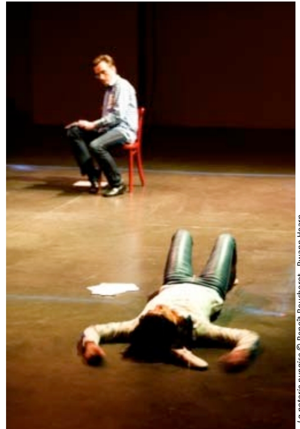
La poterie punaise

www.concordanse.com / www.lephare-ccn.fr