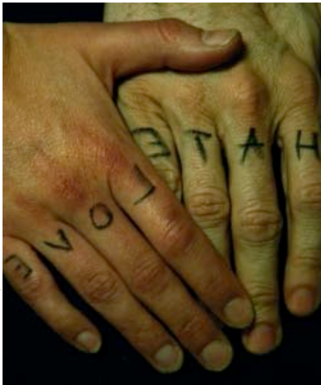
Shut your mouth © D.R.

Avec le regard de : Benoît Mochot et Dominique Boissel